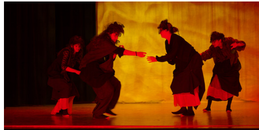
Eurythmieabschluss der 12. Klassen: Faust